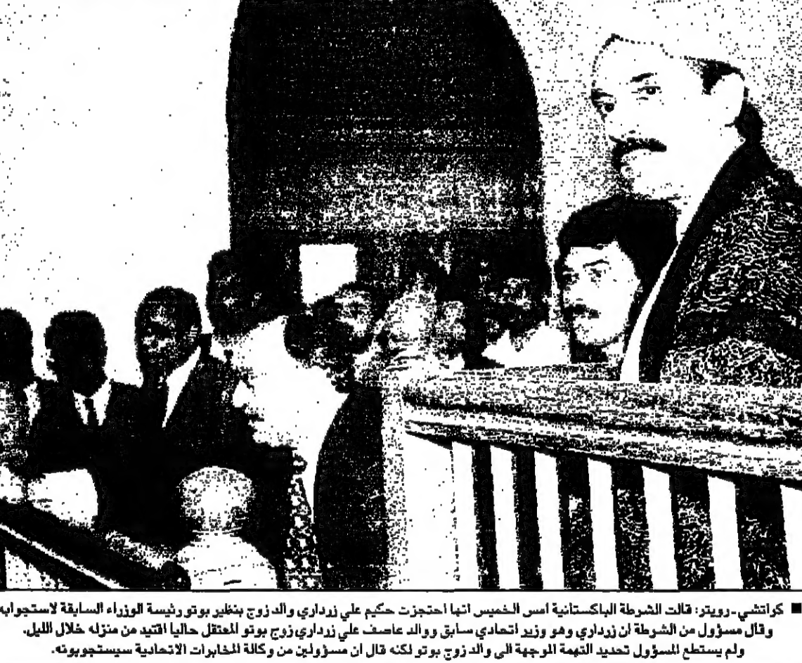
كراتشي - رويترز: قالت الشرطة الباكستانية أمس الخميس أنها اعتقلت والد زوج بنظير بوتو رئيس الوزراء السابق لاستخباراته، ولم يستطع المسؤول تحديد التهمة الموجهة له والزوج بوتو لكنه قال إن مسؤولين من وكالة المخابرات افغانيا سجنوه بتهمة التجسس.